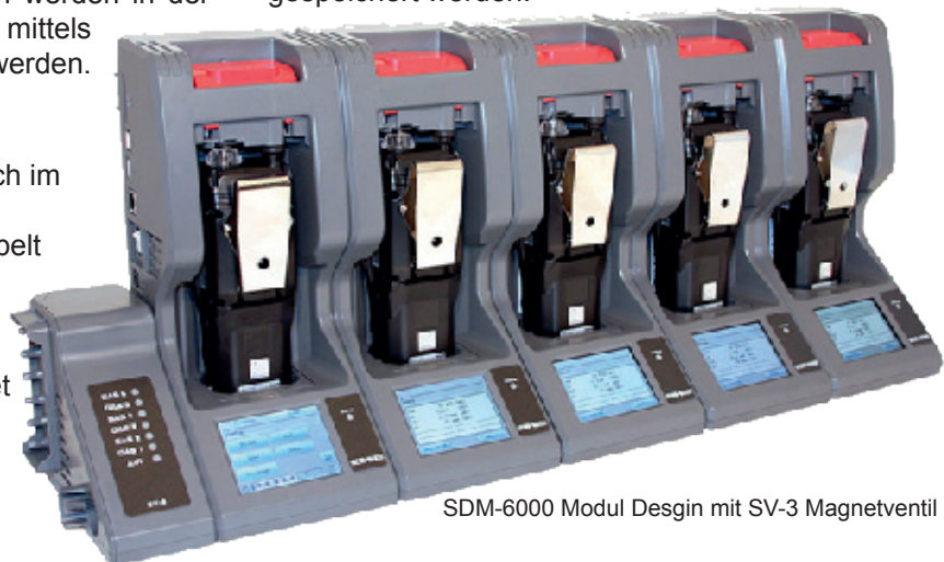
SDM-6000 Modul Design mit SV-3 Magnetventil

Bis zu 10 SDM-6000 können gekoppelt werden, sodass bis zu 10 GX-6000 gleichzeitig aufgeladen werden können. Zudem können im Modul Design mit nur einem Kalibrationsset bis zu 10 GX-6000 kalibriert und justiert werden.